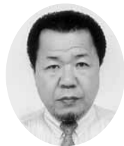
須釜副会長 (五霞地区会長)