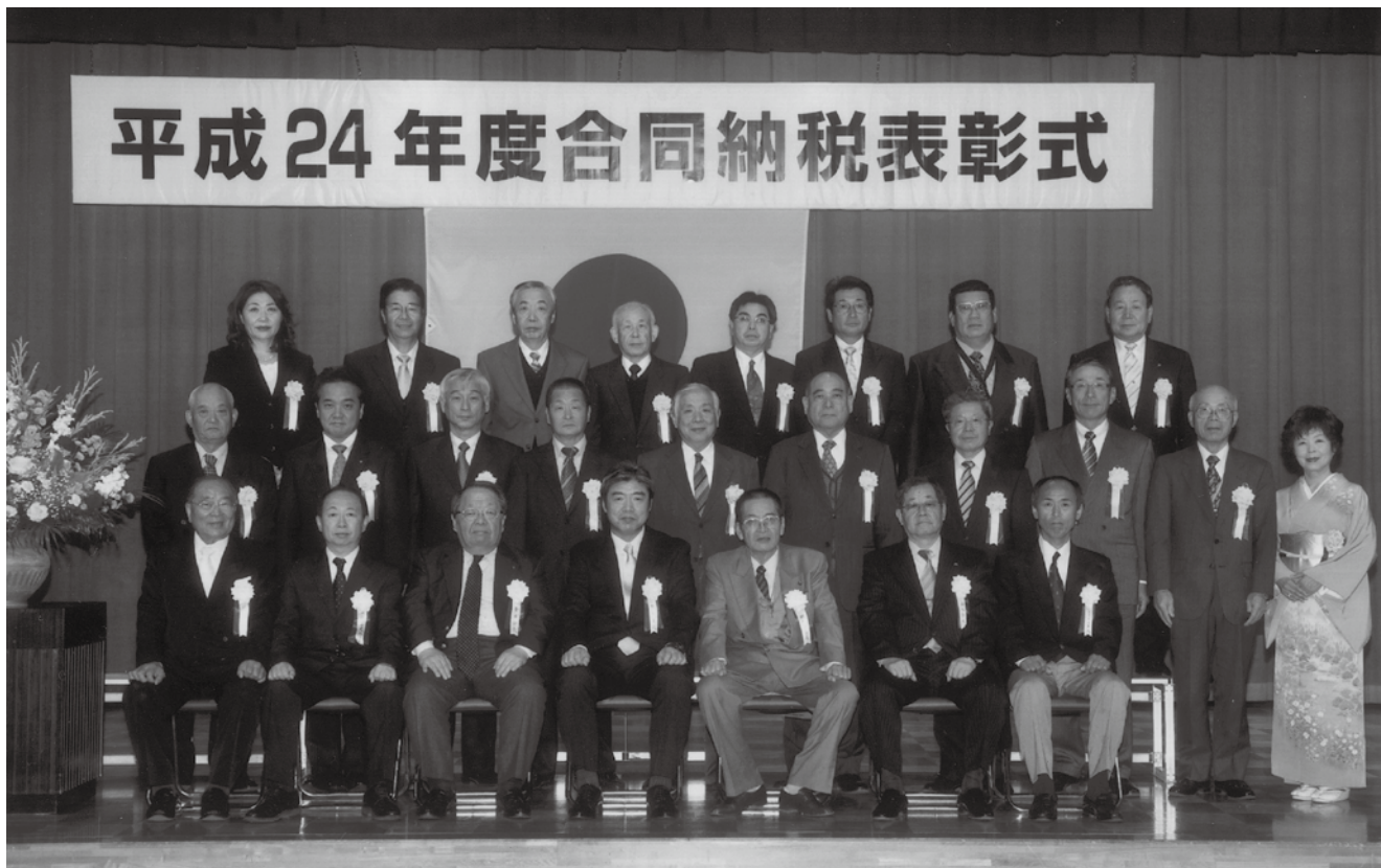
平成24年度合同納税表彰式で受賞された方々

平成24年度の合同納税表彰式が11月15日(木)に古河市生涯学習センター総和(とねミドリ館)で挙行されました。