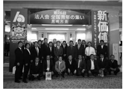
宮崎大会会場にて

☆古河駅周辺の清掃活動実施 十一月十二日(月)七時三〇分 より、第四回古河駅頭清掃ポ ランティア活動実施。