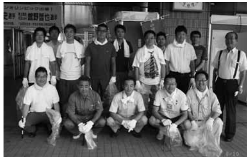
「道の日」清掃参加者集合