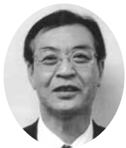
矢澤副会長 (総和地区会長)