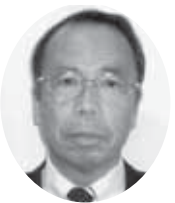
塚原副会長 (境地区会長)