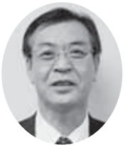
矢澤副会長 (総和地区会長)