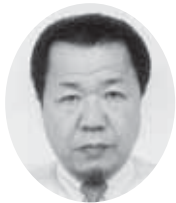
須釜副会長 (五霞地区会長)