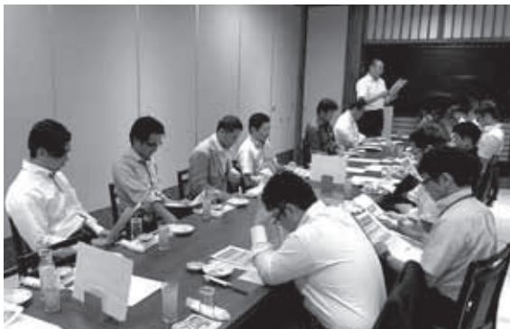
総和地区会青年部会合同税務研修会 H28年8月5日(金) 古河市「旬 おかさと」 ※古河・総和・三和地区会と合同