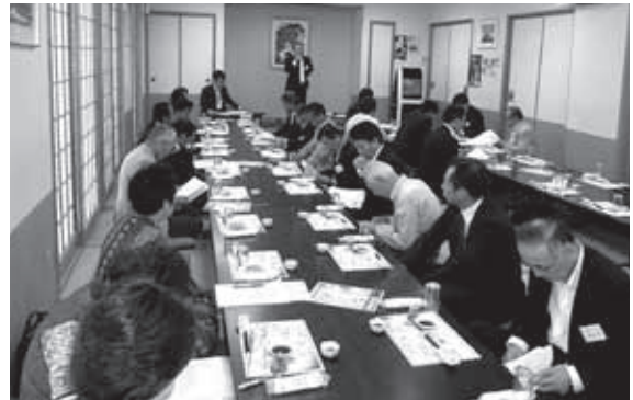
三和地区会通常総会 H28年5月28日(土) 古河市「静の里」