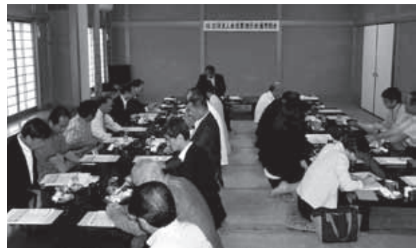
税務研修会 (通常総会時開催) H28年6月15日(水) 五霞町「一ふじ」