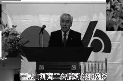
蓮見古河商工会議所会頭挨拶