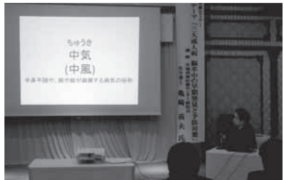
健康セミナー (通常総会時開催) H28年6月2日(木) 境町「バンケットハウス アリモール」