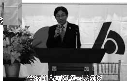
金澤前古河税務署長挨拶