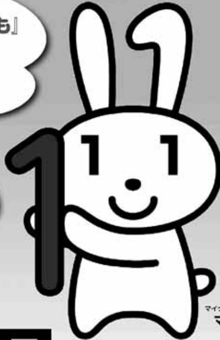
マイナンバーキャラクター マイナちゃん