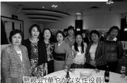
懇親会(華やかな女性役員)