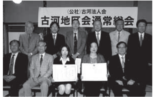
古河地区会通常総会 H28年5月11日(水) 古河市「新まき」