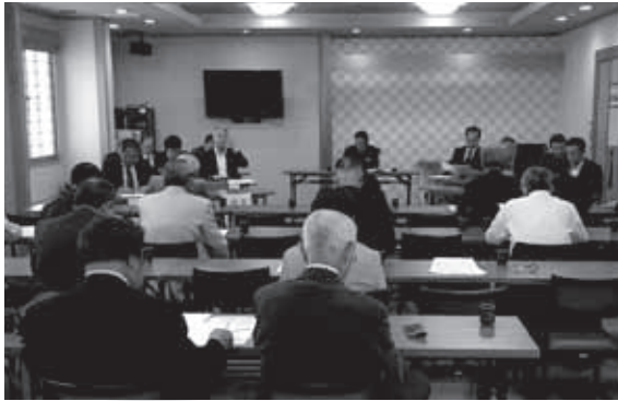
坂東地区会通常総会 H28年5月16日(月) 坂東市「あらかや」