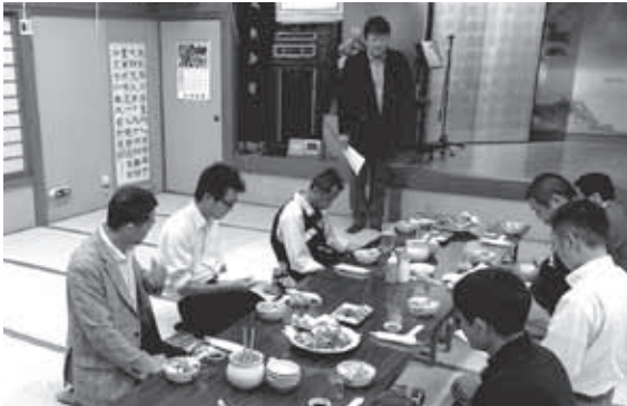
三和地区会青年部総会 H28年6月3日(金) 古河市「並木会館」