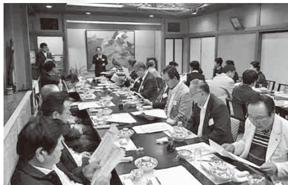
三和地区会通常総会 H29年5月19日(金)