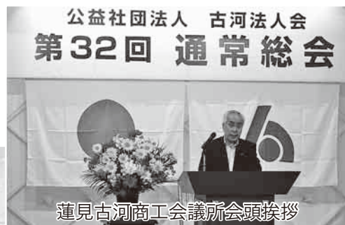
蓮見古河商工会議所会頭挨拶