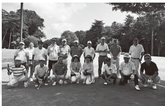
坂東地区会親睦ゴルフ H29年7月20日(木)