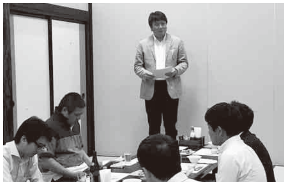
三和地区会青年部総会 H29年5月18日(木)