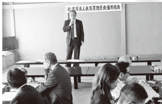
(公社) 法人会五霞地区会、 通常総会時税務研修会 H29年6月14日(水)