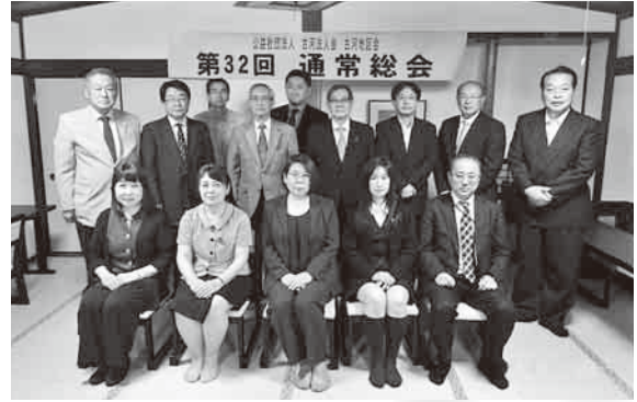
古河地区会通常総会 H29年5月16日(火)