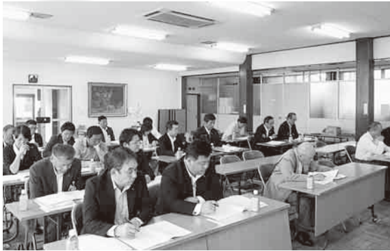
境地区会通常総会 H29年6月15日(木)