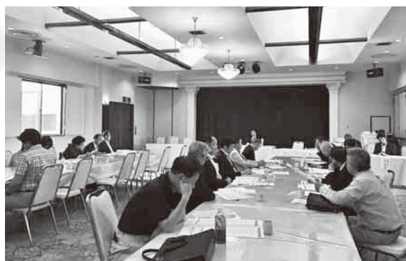
坂東地区会通常総会 H29年5月30日(火)