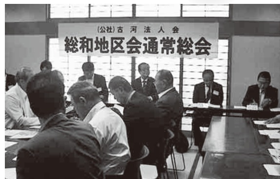
総和地区会通常総会 H29年6月9日(金)