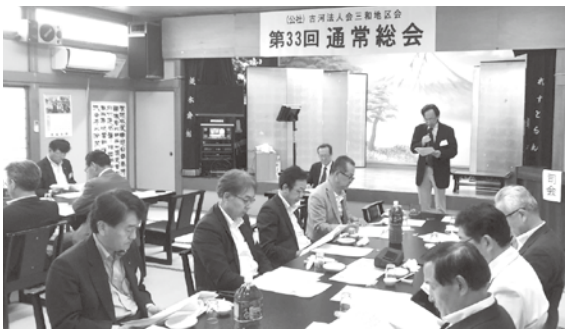
三和地区会通常総会 H30年6月1日(金)