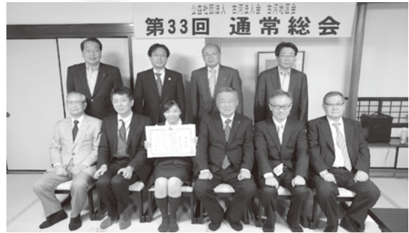
優良経理担当者表彰 H30年5月17日(木)