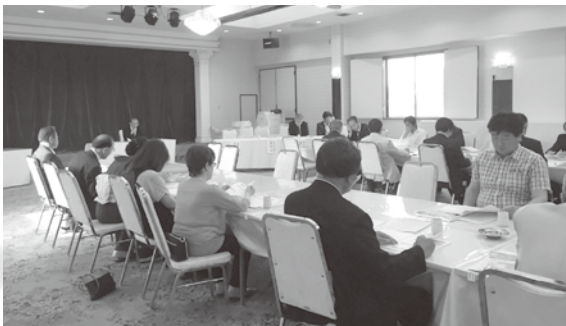
坂東地区会通常総会 H30年5月30日(水)