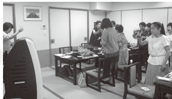
三和地区女性部会 情報交換会 H30年8月3日(金)