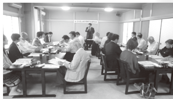
五霞地区会通常総会時税務研修会 H30年6月13日(水)

五霞町商工会は、地元産品の八つ頭(里芋の一種)を、高付加価値を持つ特産品とすべく、地域への浸透、加工品の商品化等のさまざまな取り組みを行っている。その中で、知名度向上策として、五霞産の八つ頭を「五霞いも」と名付け、これを使用した加工品や料理には、例えば「五霞いもコロッケ」というように「五霞いも」の名前を謳っていかうことになり、特許庁長官より商標原簿に登録された。