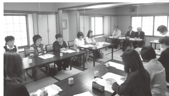
境地区会女性部通常総会 H30年6月18日(月)