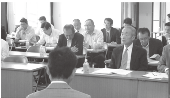
境地区会親会・青年部会合同通常総会 H30年6月13日(水)