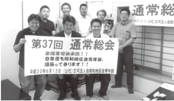
総和地区会青年部会通常総会 H30年6月13日(水)