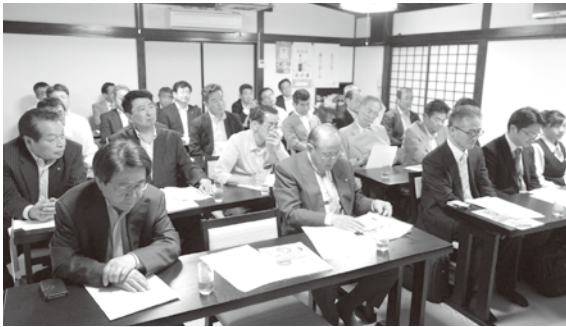
古河地区会通常総会 H30年5月17日(木)