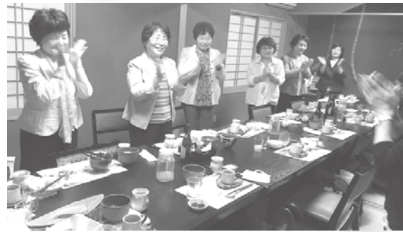
総和地区会女性部会通常総会 H30年6月13日(水)