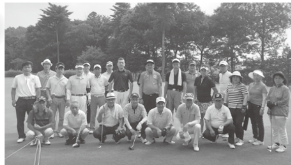
親睦ゴルフ大会 H30年7月19日(木)